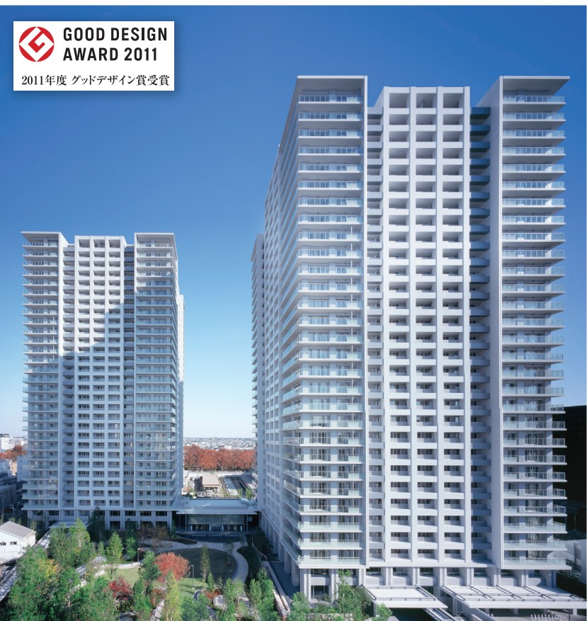
圧倒的な存在感、そのコンセプトは現代の「御屋敷」。手前に見えるのは、広大な入居者専用の回遊式庭園「グランドガーデン」。上記写真は平成22年11月、その他の共用施設は平成23年2月および9月、プレミアムプランのモデルルーム（FP-110Aタイプ、家具、調度品等は販売価格に含まれません）、平成24年1月に撮影したものです。

和の精神を継承する設え 回遊式庭園のやすらぎ 新宿まで直通二八分。乗降客数首都圏第八位、一四路線が乗り入れる「大宮」駅周辺は、県下最大の商都市として発展を続けている。一方で、関東一円に広がる氷川神社の総本社（徒歩二五分、約二七〇メートル）や大宮公園（徒歩二五分、約二七〇メートル）、そこへと連なる約二キロメートルにも及ぶ氷川参道など、駅前でありながら緑濃い閑静な環境が広がっている。敷地面積一万九三〇〇平方メートル超、三〇階建てツインタワー「グランドミッドタワーズ 大宮」は駅から徒歩七分、その氷川参道に寄り添うように、圧倒的な存在感で建っている。