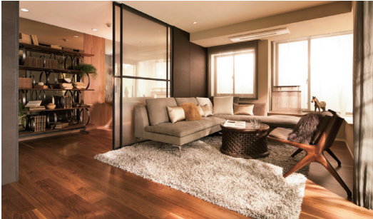
伸びやかな天井高を持ち、天然素材を多用した住戸。 ※掲載の室内写真は、「ライオンズ外苑の杜」のマンションギャラリー内モデルルーム（Kタイプ）を撮影したもので、タイプにより室内の形状、色彩、仕様等は異なります。また、一部オプション仕様、設計変更（有料、申込期限があります）が含まれています。

大理石の水盤にオブジェやスワロフスキー・エレメントなどで高雅に演出されたエントランスホール。※完成予想CG