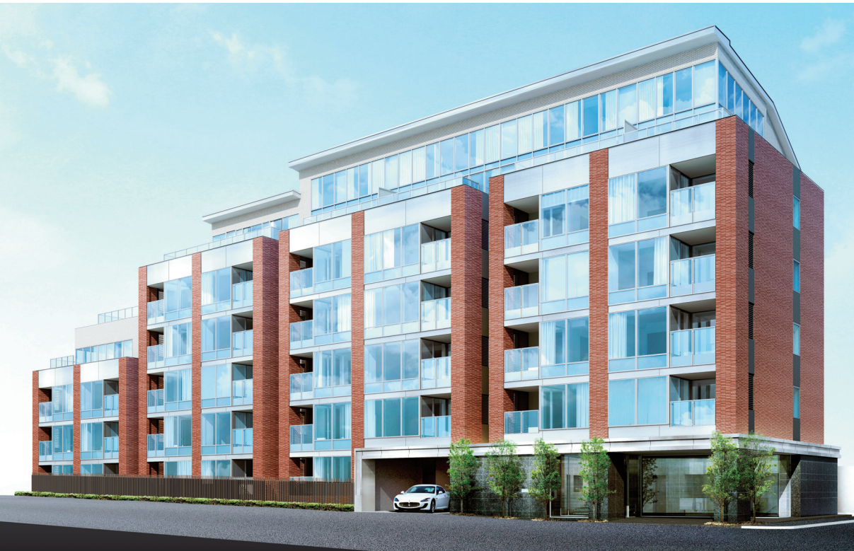
外観完成予想CG。 図面を基に描き起こしたもので、実際とは多少異なる場合があります。

に賃貸にして収益性を求める人も多いという。モデルルームの公開は七月上旬、販売開始は九月下旬を予定。詳細な住戸プランはまだ公表されていないが、モデルルームの公開が楽しみなマンションである。