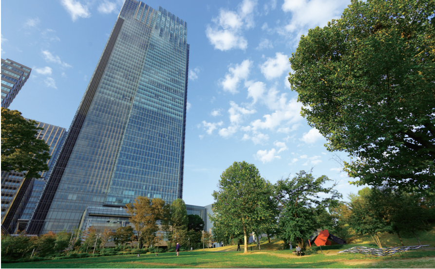
上／東京ミッドタウンのミッドタウンガーデン（現地から徒歩5分、約390m）。左／東京ミッドタウンには檜町公園（現地から徒歩4分、約300m）が隣接する。 掲載の写真は平成23年10月に撮影したものです。

「プレミスト赤坂檜町公園」は、敷地面積が約一九〇〇平方㊦、地上七階地下二階建てで、総戸数は七五戸。平成二五年三月竣工予定。清水建設の設計・施工による建物は、赤坂の地の風格に見合うよう、外観にシックな色彩のタイルを用いるとともに、ガラスウォールを多用し、良好な日当たりとこの地の先進性が表現されている。住戸は四〇・二