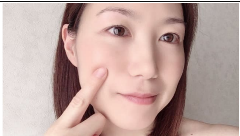
本当に自分の肌？ と疑ってしまいました😅