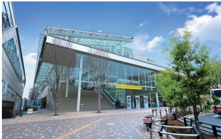
再開発された経堂駅北口のランドマークともなっている「経堂コルティ」※平成24年3月撮影。「プラウド経堂ガーデンテラス」から約60m、「プラウド経堂コートテラス」から約80m。

そんな中で、好調な売れ行きを見せているエリアがある。世田谷区の小田急線・経堂駅周辺だ。昨年、大手デベロッパー二社による高級マンション二物件が、わずか数カ月で完売した。なぜ、経堂駅周辺への注目度がそれほどまでに高いのか。この六月下旬から「プラウド経堂」の販売を開始する野村不動産の担当者（住宅営業一部）は、「経堂駅周辺は元々人気のある街でしたが、駅北口の再開発によって街が若返り、生活の利便性、快適さが一段と増したこと」がその理由とみている。