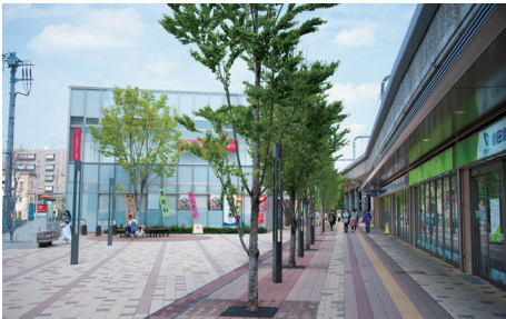
駅前には「歩きたくなるまち・経堂」をコンセプトに「経堂テラスガーデン」として整備されている。※平成24年4月撮影。「プラウド経堂ガーデンテラス」から約60m、「プラウド経堂コートテラス」から約75m。

「在来の大規模商店街に加え、駅前に経堂コルティや経堂テラスガーデンができ、華やぎのある街になりました。しかし、駅前から少し離れると、閑静な住宅街が広がっています。その両面を備えた住環境の良さが、このエリアの魅力」北口再開発は、小田急線の複々線・高架化に伴うもの。経堂コルティは、街の新たなランドマークともいえるショッピングモールで、スーパーや飲食店、書店、雑貨店からクリニックまでがそろっている。経堂テラスガーデンは、芝生広場などもある緑のプロムナード。店舗やスポーツ施設などもある。