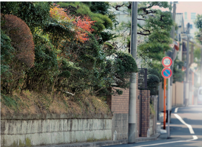
閑静な住宅街が広がっている赤堤1丁目の街並み。※平成24年2月撮影。「プラウド経堂ガーデンテラス」から約380m、「プラウド経堂コートテラス」から約420m。

当時のお屋敷街の風情は、今も損なわれてはならず、豪奢な邸宅が多く立ち並び、静謐で、成熟した住宅地の趣を携えている。付近に